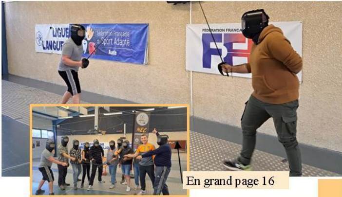
En grand page 16